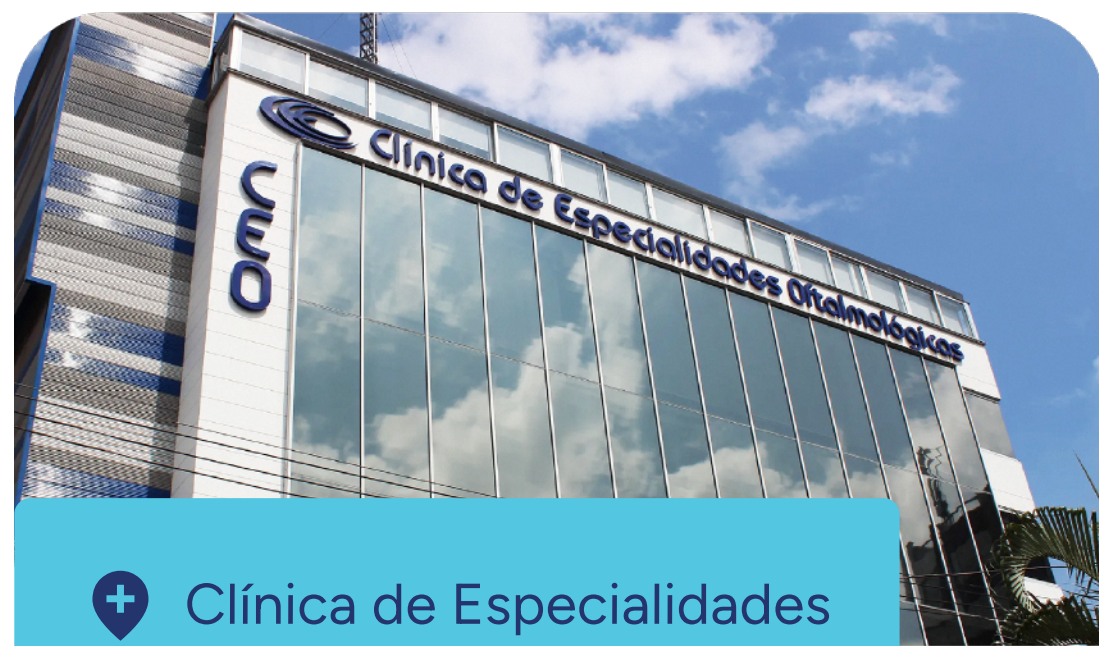
+ Clínica de Especialidades Oftalmológicas - CEO