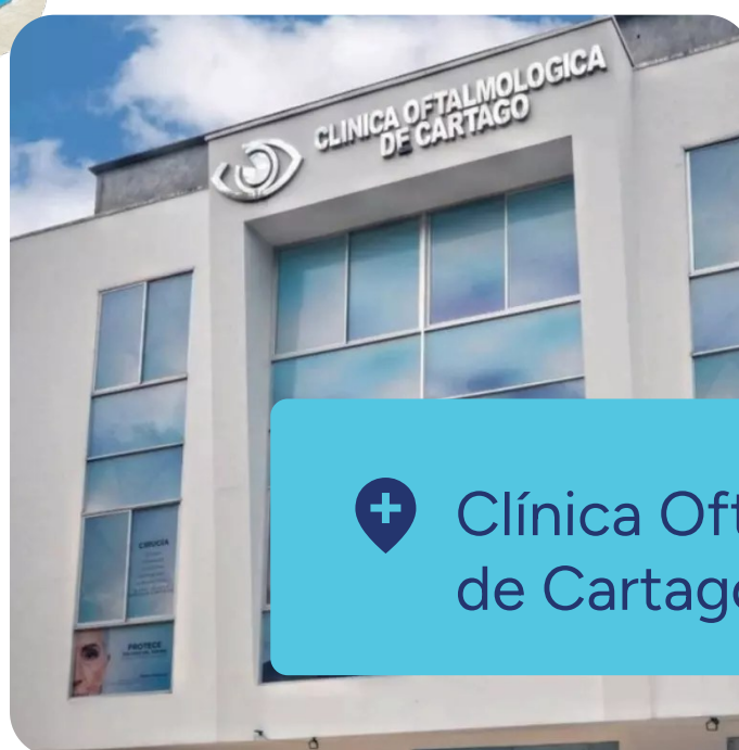
+ Clínica Oftalmológica de Cartago