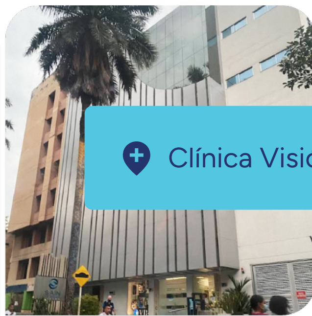
+ Clínica Visión del Valle