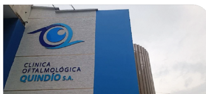
+ Clínica Oftalmológica del Quindío