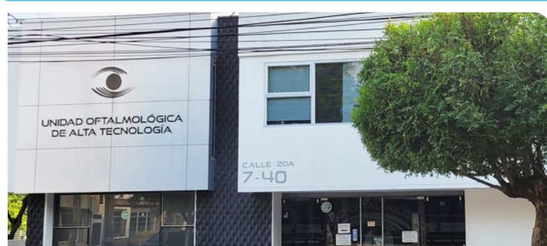
+ Clínica Oftalmológica de Alta Tecnología - Girardot