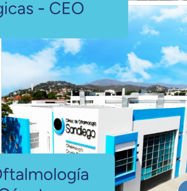
+ Clínica de Oftalmología Sandiego - Cúcuta